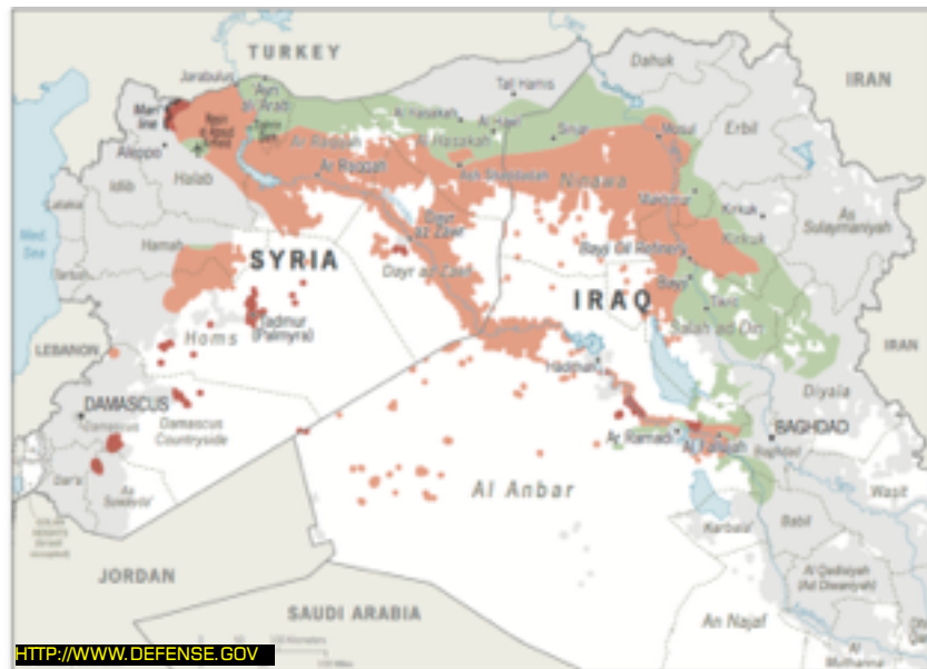
■ ISIS-ის დაკარგული ტერიტორიები ■ ISIS-ის კონტროლირებადი ტერიტორია

ამას თან ერთვის თებერვლის შემდეგ ჰამაჰსა (Hamah) და ალ-ჰასაკას (Al Hasakah) და 200-300 კილომეტრიანი მონაკვეთის დაკარგვა აღმოსავლეთ ალექსოთან.